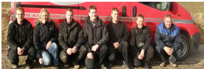
Urhøjs team af varmepumpe specialister.

Læs mere på: www.urhoj.dk eller ring 59597107